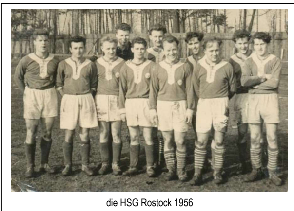
die HSG Rostock 1956

I m ersten Jahrzehnt ging es sportlich vorerst zügig bergauf. Innerhalb der Jahre 1950 bis 1953 marschierte die HSG Uni Rostock von der 2. Kreisklasse bis in die Bezirksklasse des Bezirkes Rostock. Genau zum 10-jährigen Jubiläum dann stieg unsere Mannschaft im Jahre 1960 erstmals in die Bezirksliga auf, aus der sie sich aber zwei Jahre später wieder „verabschiedete“.