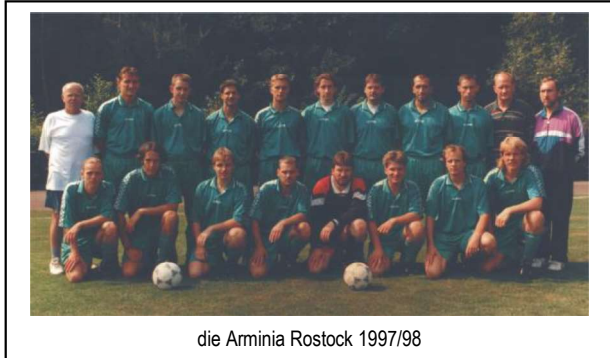
die Arminia Rostock 1997/98

Damit dokumentierten wir einerseits unsere traditionell feste Verbundenheit mit der 600 Jahre alten Universität unserer ehrwürdigen Hansestadt – standen andererseits sicher auch ein wenig in der kämpferischen Pflicht des germanischen Cheruskerfürsten Arminius, der im Jahre 9 n.Chr. die römischen Legionen im Teutoburger Wald vernichtend geschlagen hat.