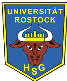
Logo von Mitte 60er bis 1975

I m ersten Jahrzehnt ging es sportlich vorerst zügig bergauf. Innerhalb der Jahre 1950 bis 1953 marschierte die HSG Uni Rostock von der 2. Kreisklasse bis in die Bezirksklasse des Bezirkes Rostock. Genau zum 10-jährigen Jubiläum dann stieg unsere Mannschaft im Jahre 1960 erstmals in die Bezirksliga auf, aus der sie sich aber zwei Jahre später wieder „verabschiedete“.