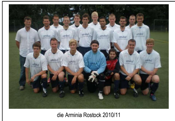
die Arminia Rostock 2010/11

Wenn wir auch mit unserem Team durch diverse Umstrukturierungen im großen Deutschen Fußball-Bund seit der Saison 2014/15 nur noch neunklassig sind, liegen wir doch immer noch in der guten Mitte unter den rund 26.000 Vereinen und 140.000 Mannschaften Deutschlands. Als kleiner Fußballclub mit dem fehlenden wirtschaftlichen Umfeld tun wir uns bezüglich eines ansprechenden finanziellen Backgrounds naturgemäß reichlich schwer. Als – im wahrsten Sinne des Wortes – Amateurverein sind wir dennoch mit den vorhandenen Möglichkeiten nicht unzufrieden. Die Vereinsführung jedenfalls geht mit den Aktiven unserer Arminia-Mannschaften anstehende Probleme engagiert an und ist Garant für die weitere Lebens- und Spielfähigkeit unseres Clubs.