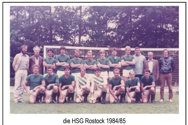
die HSG Rostock 1984/85

I m selben Jahr wurde von den Verantwortlichen und Aktiven unseres Vereins der Entschluss gefasst, zwar unter dem sportlichen Dach der HSG Rostock zu verbleiben, jedoch einen eigenständigen Fußballclub aus der Taufe zu heben. So diente uns aus Traditionsgründen als Vorlage für die Namensfindung eine ehemalige Studentenverbindung der Rostocker Universität namens ATV Arminia. Am 05. Dezember 1990 wurde so unser eigenständiger Fußballverein e.V. als „Universitäts F.C. Arminia Rostock“ (UFC Arminia) gegründet.