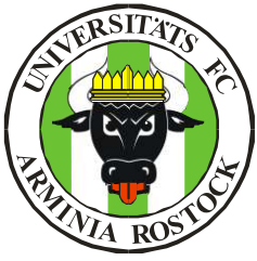
Logo des UFC Arminia

Damit dokumentierten wir einerseits unsere traditionell feste Verbundenheit mit der 600 Jahre alten Universität unserer ehrwürdigen Hansestadt – standen andererseits sicher auch ein wenig in der kämpferischen Pflicht des germanischen Cheruskerfürsten Arminius, der im Jahre 9 n.Chr. die römischen Legionen im Teutoburger Wald vernichtend geschlagen hat.