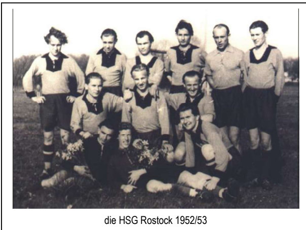
die HSG Rostock 1952/53