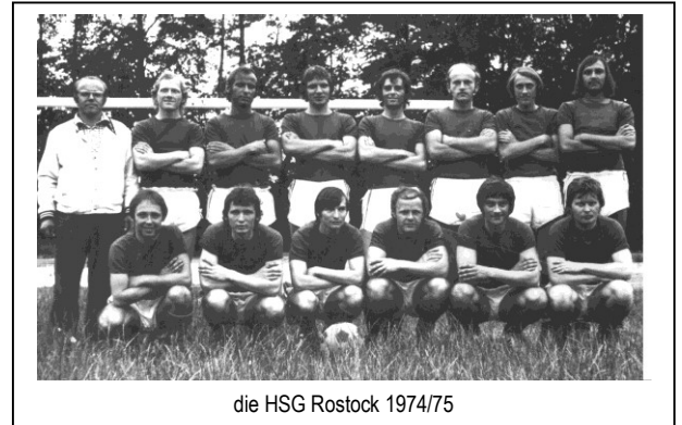
die HSG Rostock 1974/75

I n den 60er Jahren stagnierte das Leistungsvermögen zusehends und mündete 1968 im Abstieg in die 1. Kreisklasse Rostock-Stadt. Doch schon 12 Monate später war der Wiederaufstieg geschafft. Nach sechs Bezirksklassen-Jahren qualifizierten sich unsere HSGer 1975 erneut für die Bezirksliga – zu Zeiten des DFV der DDR immerhin die dritthöchste Spielklasse.