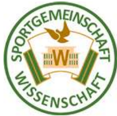
Logo von 1950 bis Mitte 60er

A ls im Herbst 1950 innerhalb der Hochschul-Sportgemeinschaft Wissenschaft der Universität Rostock auch eine Sektion HSG-Fußball ins Leben gerufen wurde, war nicht unbedingt abzusehen, dass sich daraus ein Fußballverein mit einer langen Tradition entwickeln würde. Heute aber gehört unser UFC Arminia Rostock zu den ältesten, sich noch im Spielbetrieb befindlichen Fußballvereinen in Rostock.